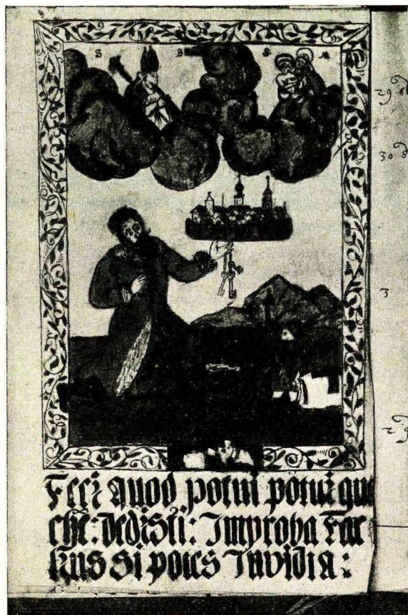
Karta tytułowa Z KSIĘGI RACHUNKOWEJ ŁUKASZA DREWNY.