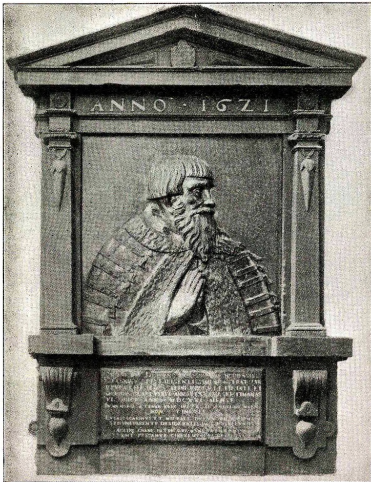
POMNIK STANISŁAWA DREWNY w Katedrze Warszawskiej.