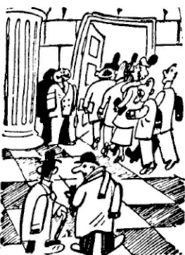
W SĄDZIE PRZYSIĘGLYCH.