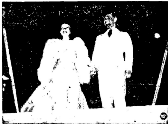
Na Rynku Starogo Miasta w Warszawie odbył się wielki koncert Jana Kiepury i Jego małżonki Marty Eggerth, z którego dochód artyści przeznaczyci na Fundusz Obrony Morskiej. — Na zdjęciu: Kiepura i Marta Eggerth na estradzie.

przedmioty pochodzą już z trzeciego tysiąclecia przed Chr. Tak duża luka tłumaczona jest wielkimi zmianami atmosferycznymi, które pramieszkańców Czech wypędziły z ich sadyb. Wykonanie przedmiotów wykazuje już znaczny postęp. Znalezione je nie tylko w przyrodniczych osiedlach, ale i w stałych siedzibach jaskiniowych. Noże, siekiery, sztylty i naczynia pochodzą już oczywiście z młodszej epoki kamiennej. Talent ludzi ówczesnych przejawiał się w pięknych zdobach na przedmiotach. W plastyce przejawiają się starodawne wizerunki religijne, przypominające wierzenia krajów wschodnich. Przeważa czezenie bogini hojności. Każła następna witryna świadczy o postępach ówczesnej ludzkości. Przedmioty są coraz kształtniejsze, z większym artystycznym wykonaniem. Niektóre pokazują nam ścisły związek z wschodem i południowym wschodem, ponieważ podobne przedmioty odkryto w starych sadybach w Lublanie, na Słowaczynie i na Ukrainie. Przedmiotów takich jest dużo, ogółem 2 000 okazów.