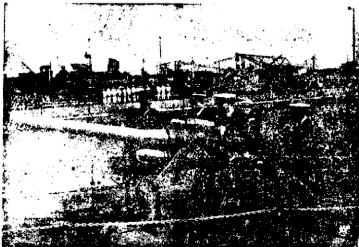
Działła obrony wybrzeża

W dalszym ciągu posiedzenia min. Bonnet wygłosił expose na temat sytuacji międzynarodowej, omawiając przede wszystkim sprawę rokowań angielsko-francusko-sowieckich, jak również sytuację w Gdańsku.