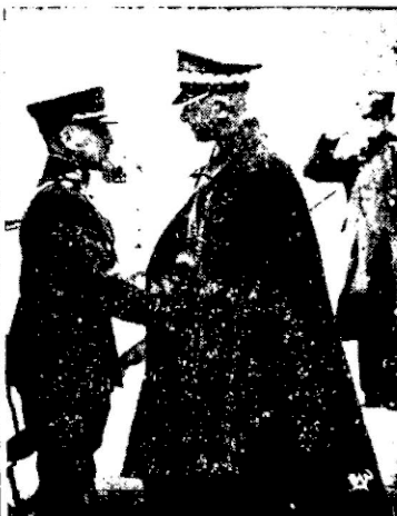
Powitanie na dworcu kolejowym w Warszawie gen. Rasztikisa przez Marszałka Eduarda Śmigłego-Rydza.

Przypuszczają, że zamach ten był dziełem irlandzkiej organizacji terrorystycznej lub też agentów obcego państwa.