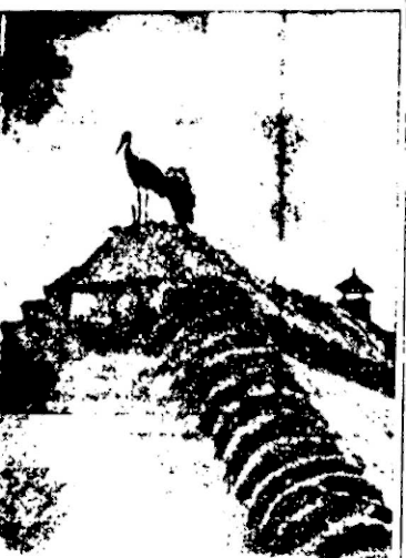
Pomierający już heron z za morza do rodzinnych stron. Rozglądając się wokół i poklepując, popracując stare, zeszluszone gniazdo.

Gdy już ptactwo podzieliło pomiędzy siebie rejony zamieszkania, rozpoczyna się budowa gniazd. Wszyscy w emy o tym dobrze, że materialny na gniazda znozą przeważnie samczyki, przy czym niekiedy pomagają im i samice, natomiast budowa konstrukcyjnego