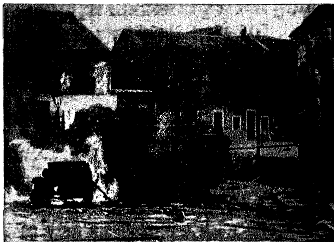
Jeden z codziennych obrazków w bombardowanym Madrycie.

wysłana została trzecia flotylla kontrtorpedowców, złożona z 9 statków z krążownikem „Galateo” na czele. Te posunięcia uważane są jako wykonanie deklaracji ministra Edena, który zapowiedział, że W. Brytania udzieli statkom handlowym brytyjskim na Morzu Śródziemnym wszelkiej niezbędnej ochrony.