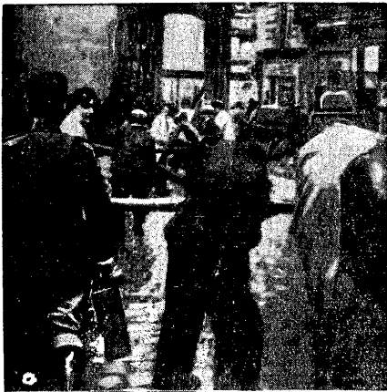
Miasteczko Angers (we Francji) nawiedził straszny pożar, ofiarą którego padła prawie że czwarta część ogólnej liczby domów. W akcji ratowniczej (jak to widzimy na zdjęciu) brała udział większa część mieszkańców miasta.

Zima nadchodzi! Tysiące ludzi jest bez dachu, bez odzieży, bez jedzenia. Ratujmy ich od zimna i głodu!