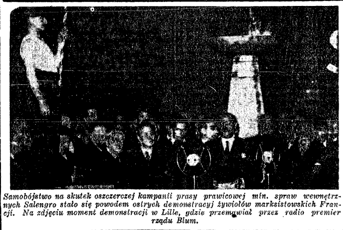
Samobójstwo na skutek oszczerczej kampanii prasy prawicowej min. spraw wewnętrznych Salengro stało się powodem ostrych demonstracji żywiołów marksistowskich Francji. Na zdjęciu moment demonstracji w Lille, gdzie przemawiał przez radio premier rządu Blum.

Na ostatnim zebraniu załogowym robotnicy „Amerykańskiego Młyna Parowego” w Żorach postanowili zarobek jednej dniówki oddać na cele pomocy zimowej dla bezrobotnych.