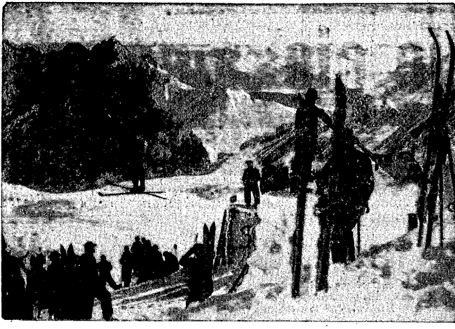
Treningi narciarskie już rozpoczęło...