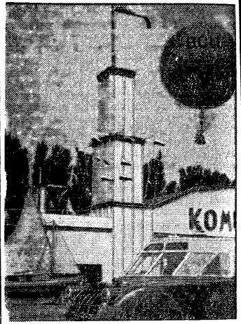
Min. Komunikacji plk. Ulrych dokonał w Warszawie otwarcia Wystawy Metalurgicznej. Na ilustracji fragment wystawy z działu: komunikacja.

W sobotę 22 sierpnia odbyły się wybory do rady zakładowej w fabryce porcelany Giesche w Katowicach-Bogucicach. Lista ZZZ otrzymała wszystkie mandaty, w liczbie 9-ciu.