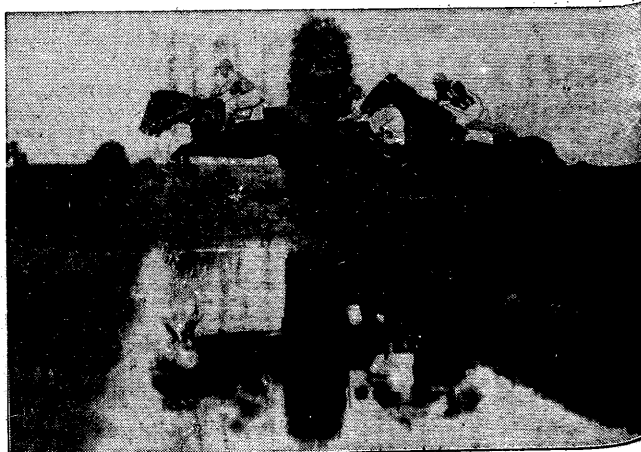
Złoty moment wyścigów konnych z przeszkodami przedstawia nasze zdjęcie.