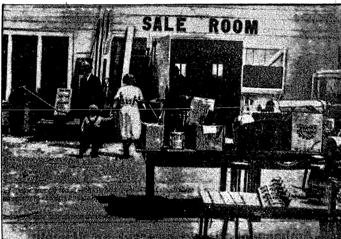
Ostatnio upały w Ameryce zrujnowały wielu farmerów, których place zostały doszczętnie wyniszczone przez promienie słoneczne. Farmerzy nagwałt wysprzedają swe ruchomości, pragnąc w ten sposób zdobyć gotówkę na opędzenie najkonieczniejszych potrzeb.

być, zgodnie z wolą kancel. Hitlera, 5,000,000 domów osiedleńczych. Akcję tę przeprowadzi „front pracy”, przy budowie zaś może „służba pracy”. Autostrady zmniejszą odległość osiedli od miast, dzięki czemu budować będzie można na tatarskich grun-tach. Koszta budowy obniżane będą nadal przez unormowanie domów budowanych w całej Rzeszy. Pierwsze próby budowy osiedli na powyższych warunkach powzięły zstąpić w dzielnicy Essen (Nadrenja), po-czem pierwszy odcinek zamierzeń osiedleń-czych Hitlera zrealizowany będzie na Ślą-sku, bowiem „Najlepszym waleń granicą” nym jest zadowolona ludność przygraniczna“.