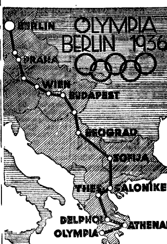
Trasa szaflety olimpijskiej Ateny — Berlin. Bieg tej gigantycznej szaflety rozpoczął się 19 b. m. Trasa wynosi 3075 km. W biegu bierze udział ponad 3000 zawodników.

W finale K. S. Concordia Knurów pokonał po bardzo interesującym i wyrównanym przebiegu gry K. S. Zgoda Bielszowice w stosunku 1:0, zdobywając tym samym puchar Dyrektora Polskich Kopalni Skarbowych jako nagrody przedchodnia. Drugie miejsce osiągnął K. S. Zgoda Bielszowice, trzecie miejsce K. S. Kresy Chorzów, czwarte miejsce „Weinowie 25”.