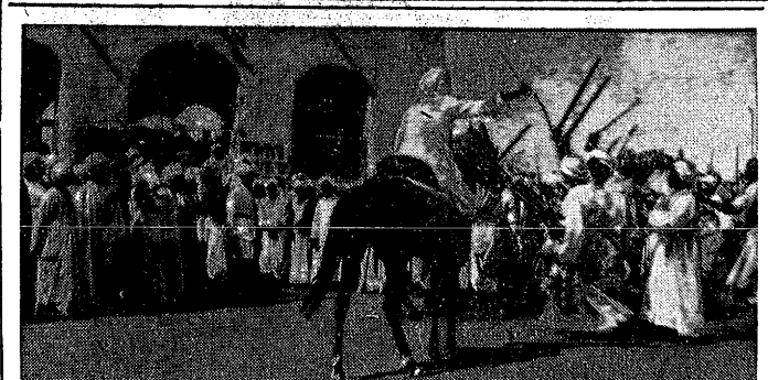
Na wieść o urodzeniu się syna jednemu z sudańskich szeków, podwładni jako wyraz swej radości urządzają „turnieje”, którym przypatruje się z wielkim zainteresowaniem starszyzna, kobiety i dzieci osad.

w którym Komendant Józef Piłsudski chwycił w swoje ręce losy Polski. Ten dzień, jak słup graniczny znaczny granice dwóch epok dziejów polskich: epokę bezsilności i bierności i drugą, biorącą swój początek od Komendanta i w stosunku do dziejów polskich najbardziej aktywnej i twórczej postawy na przestrzeni długich stuleci. Sadzę, że jeśli mamy ten dzień święcić naszym zjazdem, to zjazd musi swoją pracę podnie odpowiedzieć treści tej rocznicy, której zasadniczą cechą jest postawa czynna i wielki wysiłek. Niedawno dopiero zaczęliśmy pracę w nowym ustroju organizacyjnym. Dla dokonania pracy, dla możliwości jej oceny, potrzebny jest czas. Dlatego w tym roku zjazd się nie odbędzie. Pamiętajmy o tem, by w roku 1937 każdy z nas mógł sobie powiedzieć wobec Kopca Komendanta: Pracą swoją w ciągu ubiegłych miesięcy udowodniłem, że rozumiem wielką treść daty — 6 sierpnia. Rydz-Śmigły.”