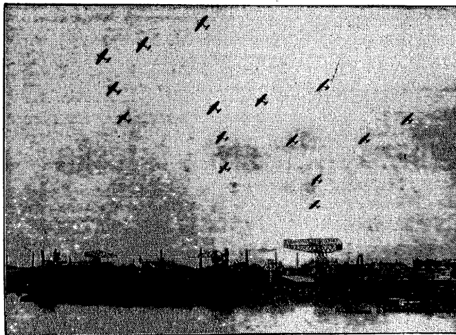
Nad Hamburgiem odbyły się ostatnio wielkie manewry niemieckiej floty powietrznej. Powyższe zdjęcie przedstawia fragment z tych ćwiczeń lotniczych.